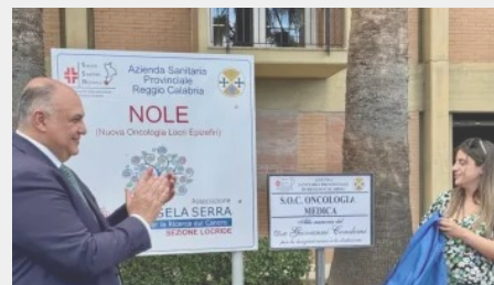
Iniziativa e sviluppi strategici al centro dell'azione della Regione Calabria 12 Luglio 2025 In "Attualità"